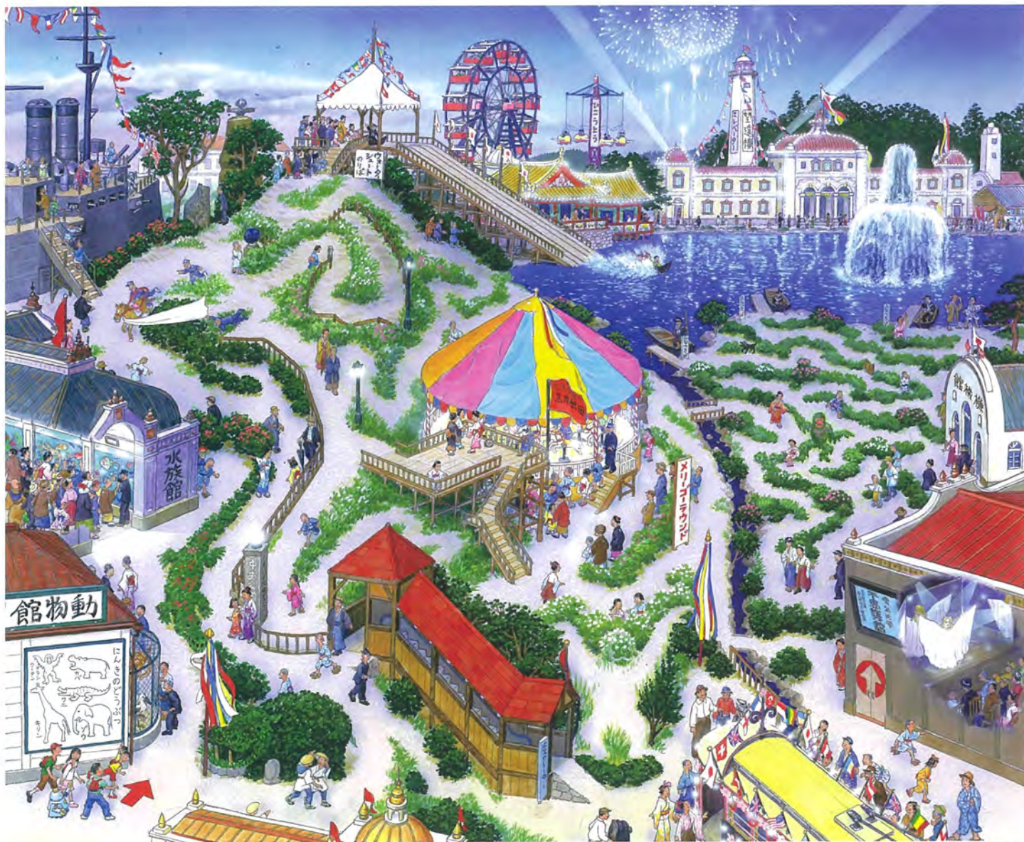
(博覧会) (『続・時の迷路』2009年)