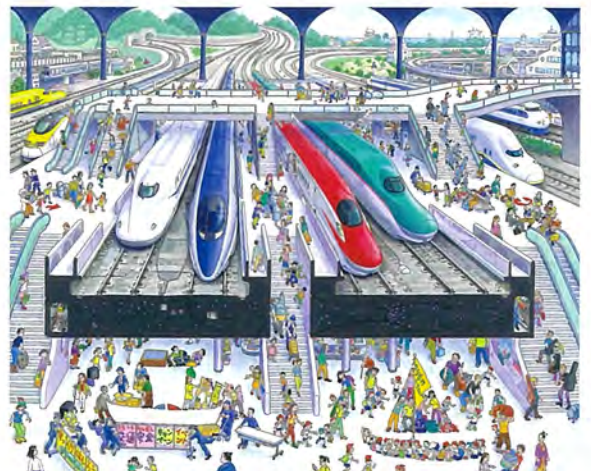
〈新幹線の駅〉(『乗り物の迷路』2013年)