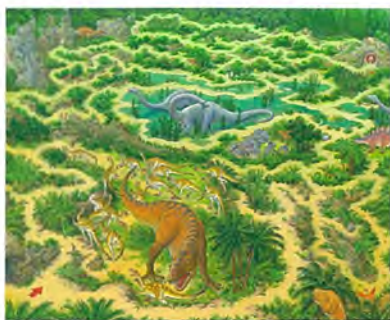
〈恐竜時代〉(『時の迷路』2005年)