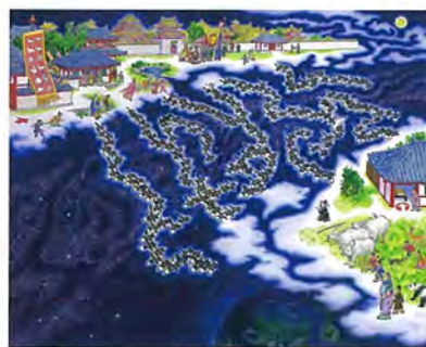
〈七夕〉(『伝説の迷路』2008年)