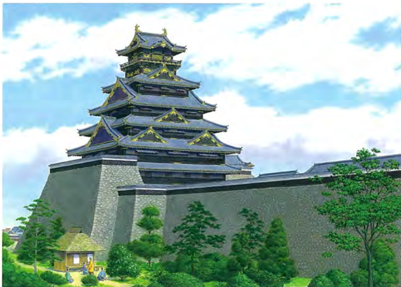
〈豊臣時代の大阪城天守〉1993年