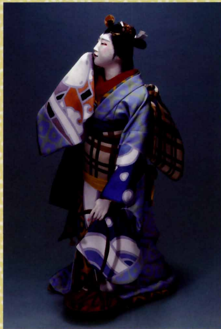
西鶴五人女よりおなつ