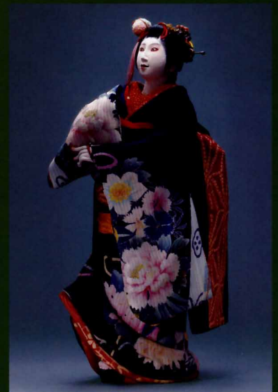
南北五人女よりお染