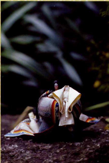
源氏絵巻縁起より桐壺