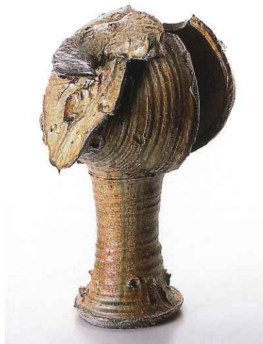
「穴窯による花入れ」2012年