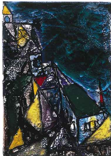
「陶板 色彩都市(部分)」1963年