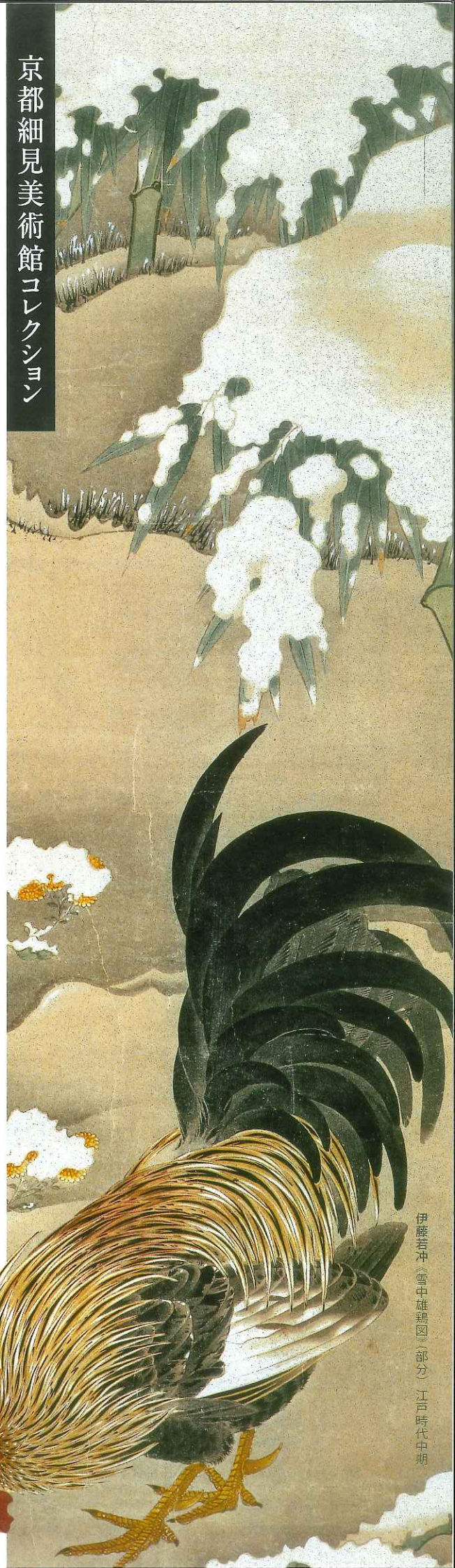
伊藤若冲《雪中雄鶏圖》(部分) 江戸時代中期