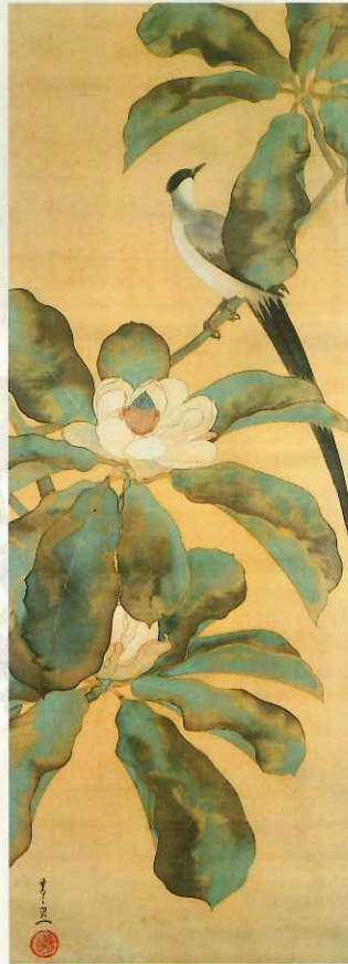
鈴木其一《朴に尾長鳥図》江戸後期 後期展示