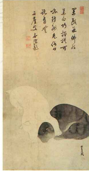
依屋宗達《双犬図》 江戸前期