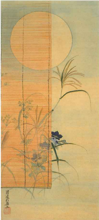
渡辺始興《簾に秋月図》江戸中期 前期展示