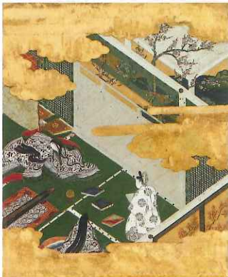
土佐光吉《源氏物語図色紙「初音」》江戸初期 前期展示