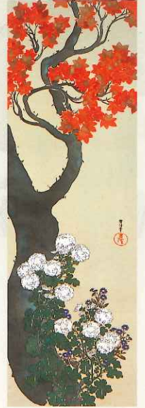
神坂雪佳《紅葉白菊図》 大正時代