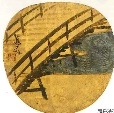
尾形光琳 《宇治橋図団扇》 江戸中期