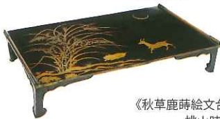
《秋草鹿時絵文台》 桃山時代

※会期中作品の入替があります。●前期:7月6日(土)~8月4日(日) ●後期:8月6日(火)~9月1日(日)