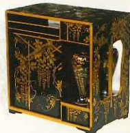
《藤時絵提重》 江戸後期