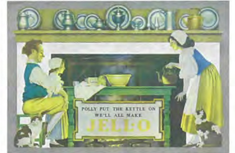
マックスフィールド・パリッシュ《おやつ時間》ジェロの広告 1923年 ©MAXFIELD PARRISH-LICENSED by ASaP WORLDWIDE/VAGA at ARS, NY/JASPAR, Tokyo 2023 G3333