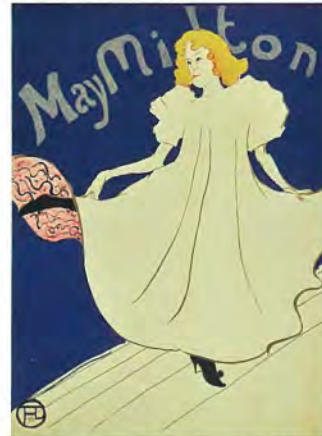
トゥールーズ・ロートレック 《メイ・ミルトン》1895年