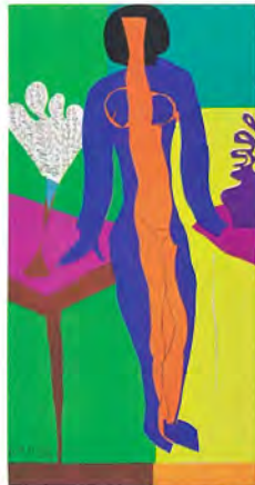
アンリ・マティス《ズルマ》 美術文芸誌「ヴェルヴ」35-36号に収録 1958年