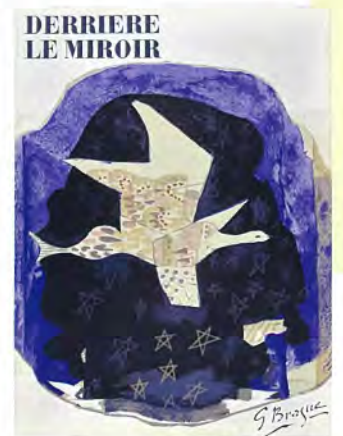
ジョルジュ・ブラック 美術雑誌「デリエール・ミロワール」の表紙 1959年