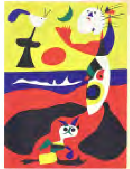
ジョアン・ミロ《夏》美術文芸誌「ヴェルヴ」3号に収録 1938年

シャガールをはじめ、ピカソ、ミロ、ダリといった近代美術の大家と、パリッシュとロックウェルというアメリカの国民的画家。誰もが一度は見聞きしたことがある、20世紀の巨匠による版画達の世界をお楽しみください。