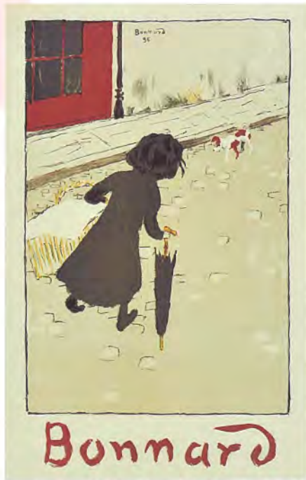
ピエール・ボナール《小さな洗濯女》1896年