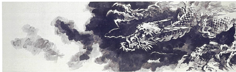
「龍安寺 奉納襖絵の下図」2020~2021年