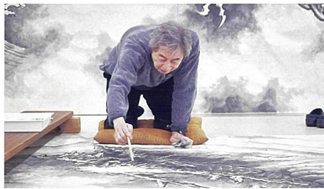
近影 アトリエにて

パラミタミュージアムでは2008年に展覧会を開催し、陶芸作品を中心に展示しましたが、近年は名だたる寺院に襖絵、屏風、障壁画を奉納するなど、制作領域の幅を広げています。今回はこれまでに奉納された襖絵・障壁画の下図をはじめ、氏が取り組む画業を紹介するとともに、陶芸・漆芸・油絵・水墨画など、幅広く美の探求を続ける細川護熙の世界をご覧ください。またあわせて、2023年に細川護熙氏が奉納した、京都 南禅寺の塔頭寺院・天授庵の「赤壁舟遊図」(襖絵八面)を特別展示いたします。