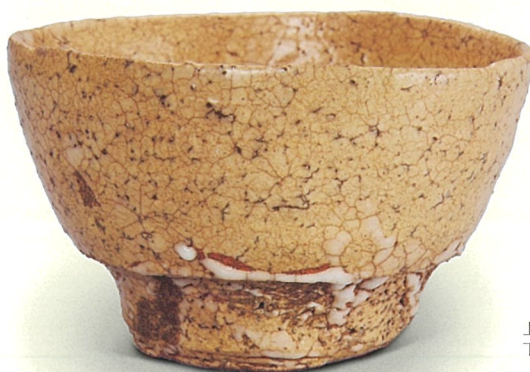
上：「双龍図」2020年 下：「井戸茶盃 独坐」1990年